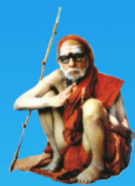
గురు చంద్రశేఖర పరమాచార్య