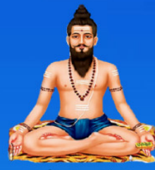
గురు విరభద్రాచార్య స్వామి